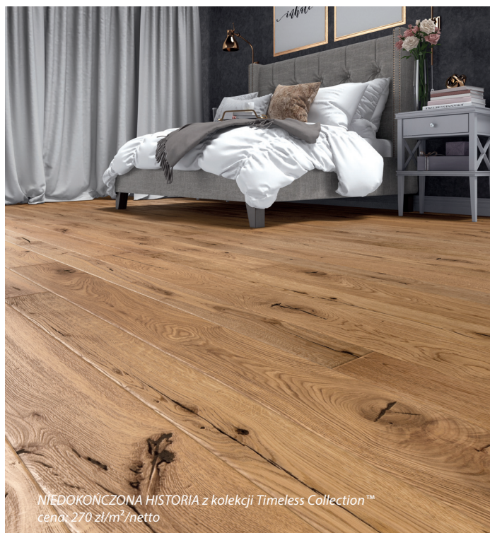
NIEDOKOŃCZONA HISTORIA z kolekcji Timeless Collection™ cena: 270 zł/m 2 netto

Baltic Wood to polski producent trójwarstwowych podłóg drewnianych, który od ponad 20 lat projektuje i wdraża kolekcje podłóg w kategorii PREMIUM, zgodnie z najnowszymi trendami w modzie i designie oraz wymaganiami rynku. Unikalna strategia marki i filozofia oparta na wartościach takich jak kreacja, estetyka, jakość, perfekcja, nowoczesność, ekoodpowiedzialność – okazała się receptą na sukces. Baltic Wood skupia się na zapewnieniu klientom szerokiego wyboru podłóg. W ofercie marki znajdują się 4 kolekcje podłóg, wykonanych z najlepszych gatunków drewna europejskiego i wybranych gatunków egzotycznych, tj. podłogi ręcznie postarzone (Timeless Collection™), ultrawytrzymałe (NoLimits Collection™), z identycznym wykończeniem na desce 1-rzędowej i klepce (Jeans Collection™) oraz w różnych rozmiarach i wykończeniach (Melody Collection™). Baltic Wood jako jedyny producent podłóg drewnianych w Polsce i czwarty na świecie został uhonorowany Red Dot Design Award w kategorii Product Design. Firma zajęła również I miejsce w plebiscycie konsumenckim „Dobra Marka – Jakość, Zaufanie, Renoma” i zdobyła specjalne wyróżnienie – godło „Super Marka” w kategorii: podłogi drewniane.