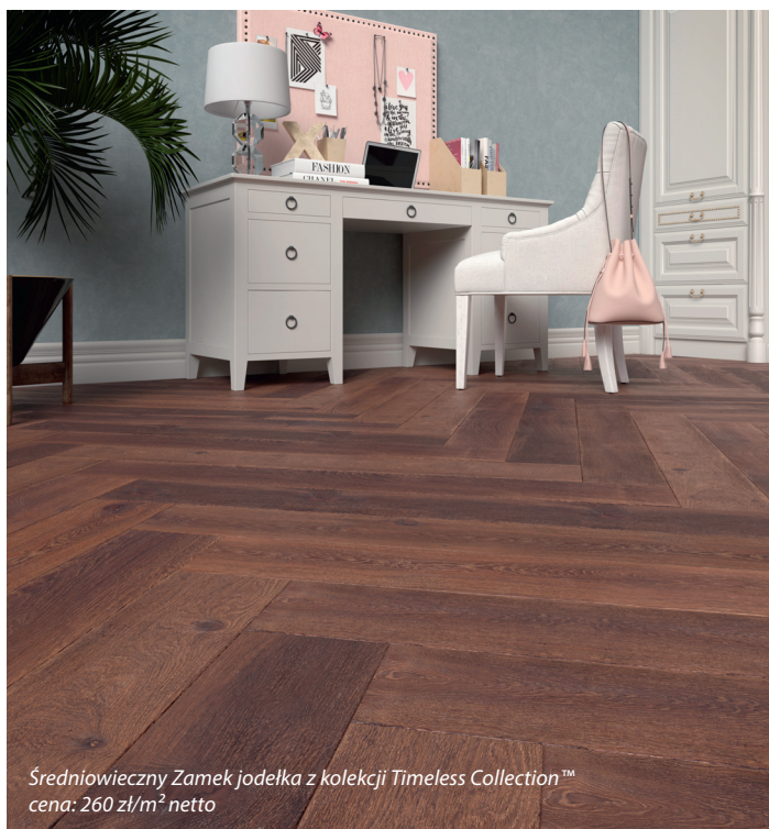
Średniowieczny Zamek jodełka z kolekcji Timeless Collection™ cena: 260 zł/m 2 netto